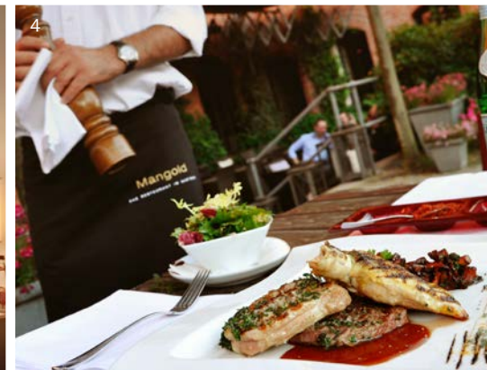
1 Denk.mal Halle · 2 L.BAR im Gastwerk · 3 Atrium-Zimmer · 4 Restaurant Mangold Sommerterrasse