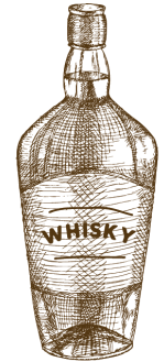
STAGE 6 BOTTLING