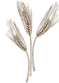
STAGE 1 MALTING