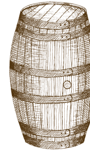
STAGE 5 MATURATION