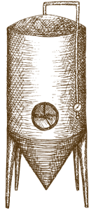
STAGE 3 FERMENTATION