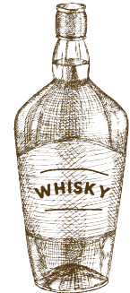
STAGE 6 BOTTLING