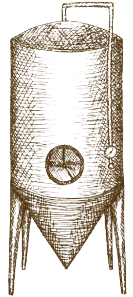
STAGE 3 FERMENTATION